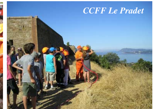
CCFF Le Pradet